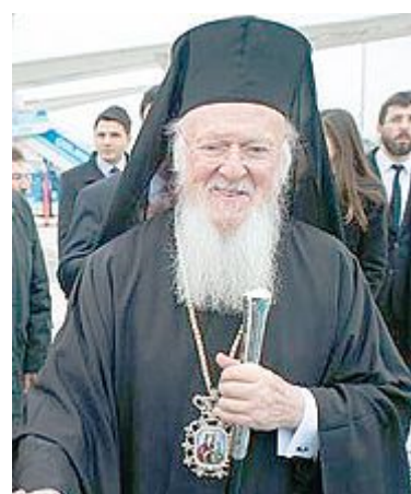
PATRIARCA Bartolomeo

I cardinali Maradiaga e Turkson: l'enciclica si muoverà su un piano etico e pastorale, non bisogna attendersi prese di posizione su dottrine scientifiche in materia ambientale